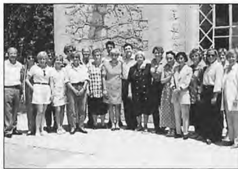
Varias Presidentas con las Autoridades.