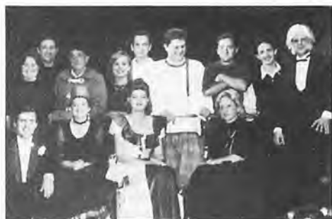
1996 el primer premio al Millor muntatge i direcció del VIII Certamen de Consell y Teatre Principal .