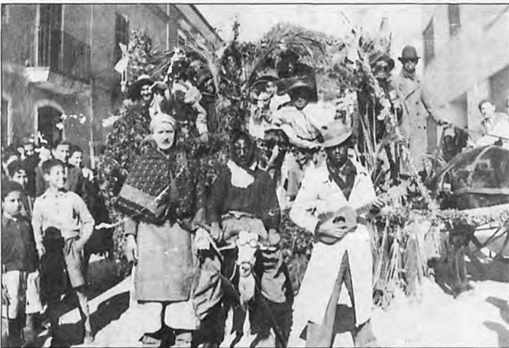
Les festes de Sant Antoni d'Andratx l'any 1949.