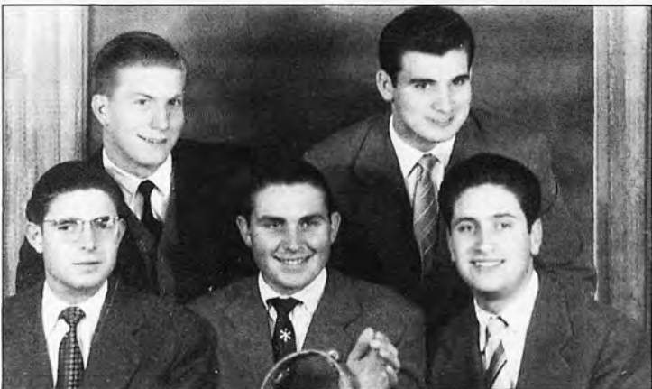
Un grup de companys andritxols a l'any 1956.