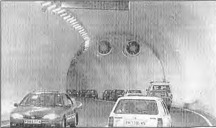
Los automóviles ya circulan por el túnel de Sóller.