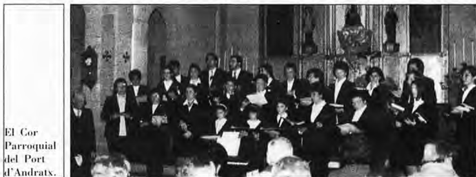
El Cor Parroquial del Port d'Andratx.