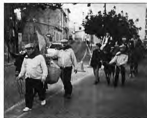
Els Carreters d'Andratx

Por su parte nos consta que el Ayuntamiento ha reforzado la vigilancia nocturna de policías locales y ha solicitado ayuda a la Delegación de Gobierno para que se amplie la vigilancia de la Guardia Civil.