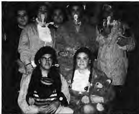
Fiesta de Carnaval

• Ultimamente se ha debatido en las televisiones locales de Palma y en la prensa, temas que afectan muy de cerca a nuestra comarca, como son la compra de terrenos y casas por parte de alemanes, y el cierre de caminos de montaña por parte de los propietarios, que empieza a generar conflictos por la masificación del excursionismo. Proprietarios y excursionistas difieren ante el derecho de paso.