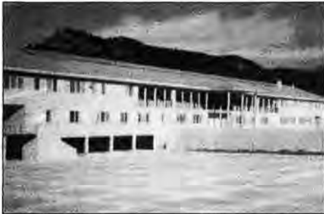
El nuevo Instituto de Enseñanza Secundaria de Andratx.

En la (Planta Primera) de 1.684 metros se encuentra, el aula de dibujo,