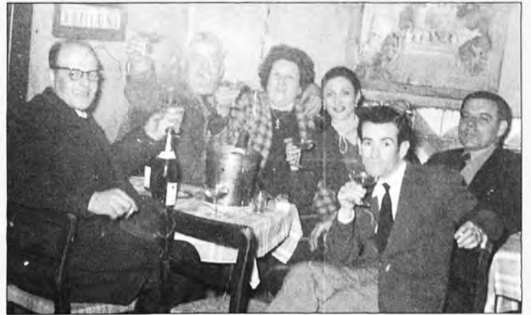
Un grup de reconrers a Ca'n Vallés de ciutat, l'any 1950.