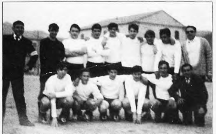
El popular C.D. La Trapa de s'Arracó, l'any 1969.