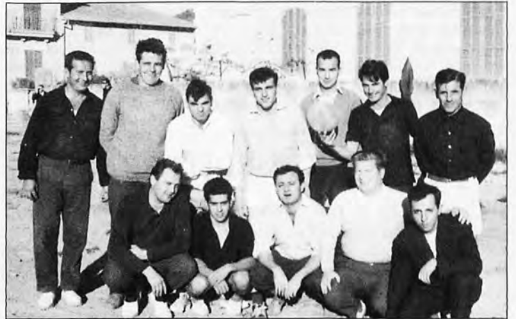
Un grup d'amics jugant un partit de futbol a s'Arracó, l'any 1962.