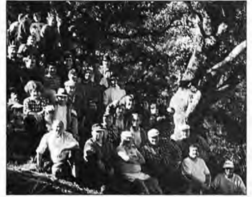
Els Carreters d'Andratx.