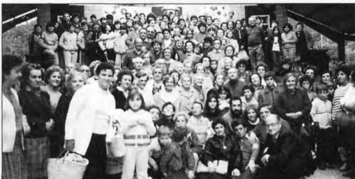
Una excursió d'andritxols al Monasteri de Lluc, l'any 1980.