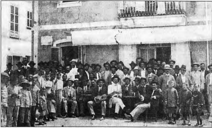
Celebrant una festa l'any 1931, al popular "Bar Ca N'Andreu" de la Plaça España d'Andratx, avui Optica Jena.