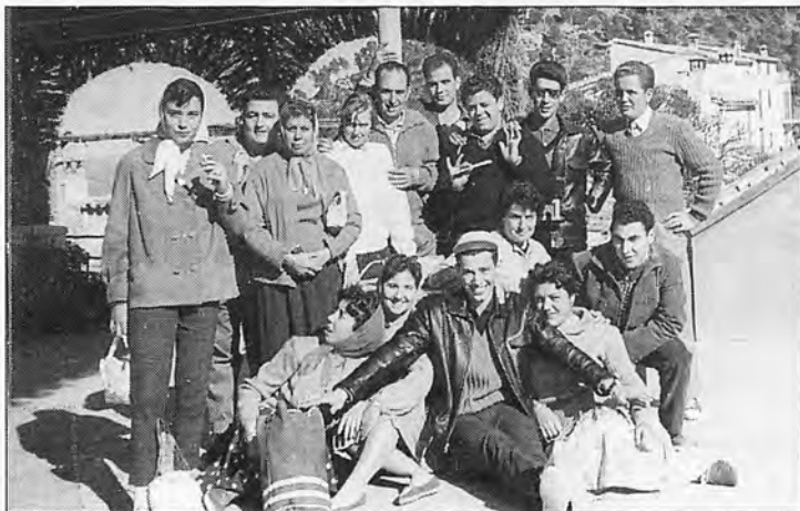
Excursión a Lluc a pie (1.960).