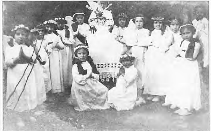
Las niñas de s'Arracó en una fiesta religiosa en 1.930.