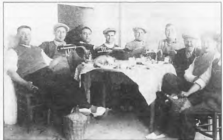
Los jóvenes de s'Arracó en 1.943 celebrando una comilona en Sant Elm.