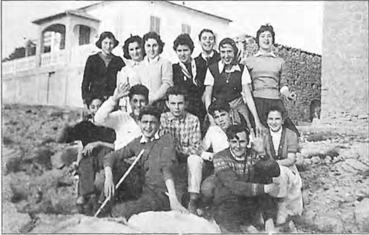
Grupo Adelita (1.959).

Unos grupos de jóvenes de Andratx de excursión: