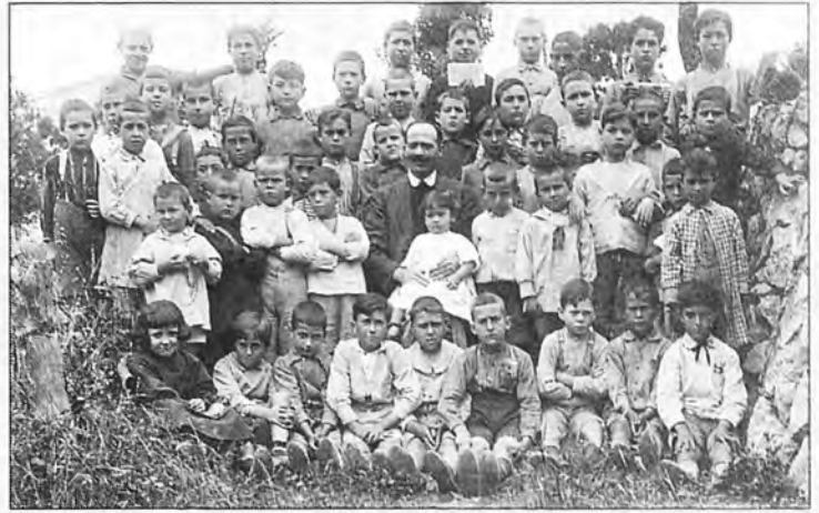
Los alumnos del colegio de s'Arracó en 1.925.