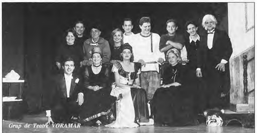
Grup de Teatre VORAMAR

Las Fiestas Patronales del presente año se