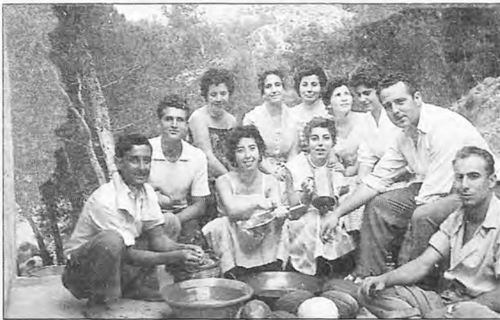
Grupo Adelita (1.960).