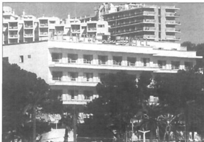
El hotel Atlantic fue construido en 1959 y tenía una capacidad para 150 plazas.

La plage militaire d'Illetas va enfin être ouverte au public l'été prochain. Une vieille aspiration des «palmesanos»!