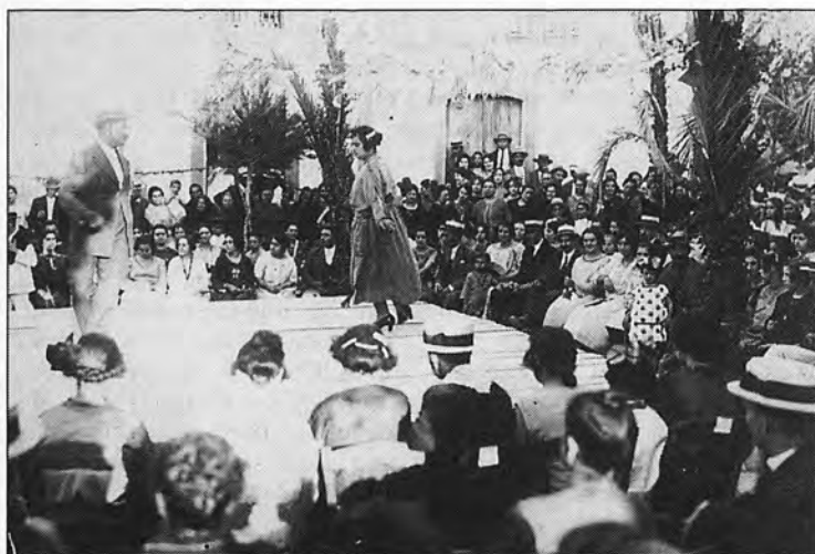
Dos instantáneas de las Fiestas de San Agustín de s'Arracó en 1923 con los mozos y mozas de aquella época.