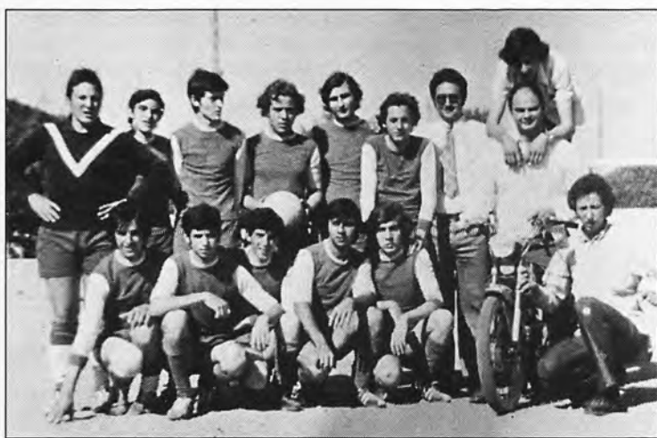
El equipo de fútbol del Bar Salon Recreo de Andratx en 1970.