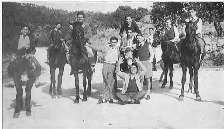
En Andratx en 1954.