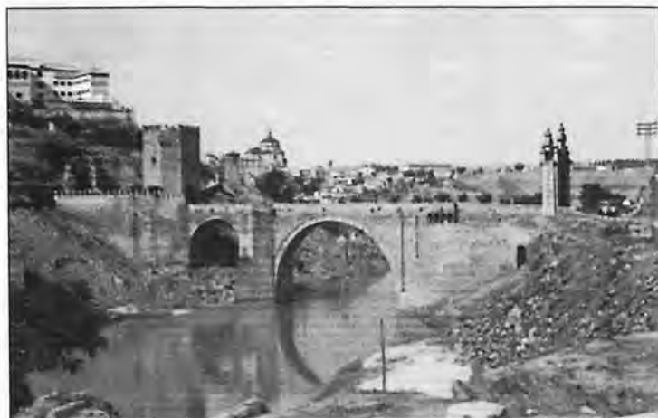
Toledo. El río Tajo y Puente de Alcántara.

En aquellos años a la juventud arraconense se les fue despertando el “gusanillo” por la afición y práctica por algún