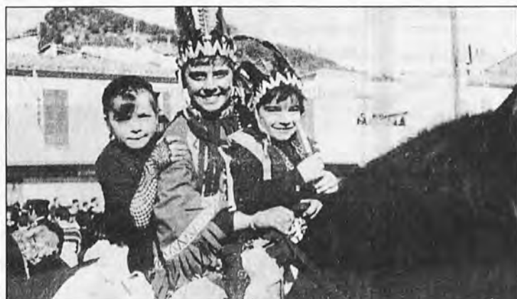
Las fiestas de Sant Antoni de nuestra villa en el año 1977.