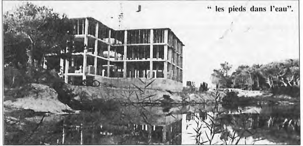
" les pieds dans l'eau".