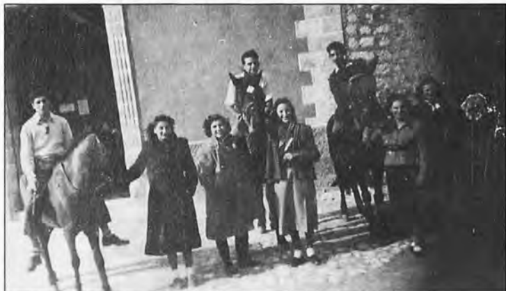
En S'Arracó en 1950.

Las Fiestas de Sant Antoni en nuestra comarca en diferentes años.