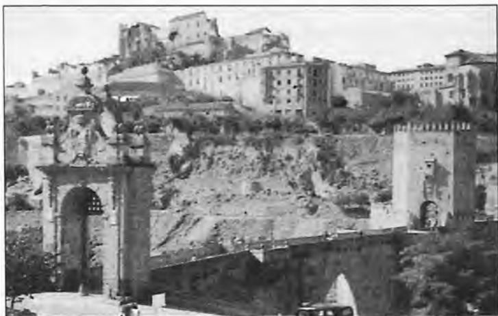
Toledo. Puente de Alcántara.

Transcurridos varios años de la guerra de Liberación no visité a la villa de Borox, de unas 1800 almas en aquellos años. Toledo fue una bellísima ciudad que me impresionó muy de veras. El Alcázar derruido por las acometidas de los cañonazos. No pude asimilar cuanto sufrirían los defensores de aquella fortaleza. Impresionante las salas de estudio, los paritorios de aquellas mujeres valerosas, los molinillos en los que se trituraba el trigo convirtiéndolo en harina y el despacho que ocupó el coronel Moscardó, etc., etc.