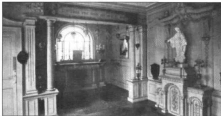
AUX BUISSONNETS, LA CHAMBRE DU MIRACLE.