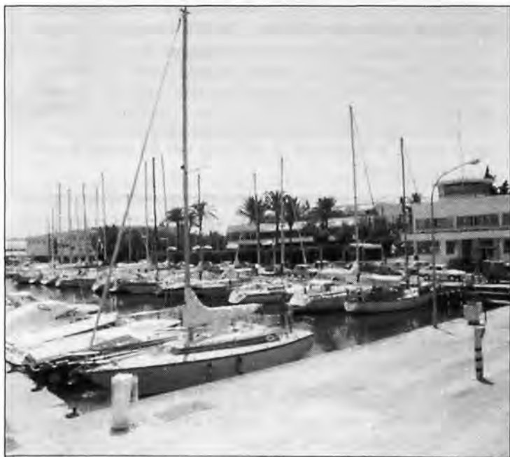
Ce tourisme de luxe, dont nous avons tant besoin.

Il est hors de doute que l'arrivée du tourisme à Majorque, au fil des années soixante a bouleversé la vie de l'île sous tous les aspects. Tout a changé: la société, l'urbanisme, l'économie,