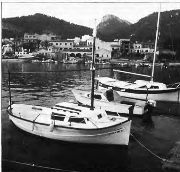
Bella estampa marinera en el Port de Andraitx.

Pero esas circunstancias, imperantes hace un siglo, están actualmente superadas. La motorización ha propiciado la inversión de valores. Esos pueblos ribereños derraman su crecimiento hacia la costa. Son las explotaciones agrícolas las que han entrado en decadencia. No tienen rentabilidad. El desfase entre