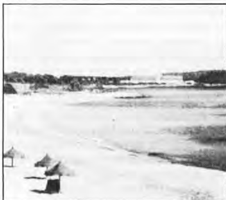
Plage du Migjorn.

Il est encore trop tôt pour affirmer que Formentera est définitivement sauvée; mais l'idée est là, et le futur a la parole.