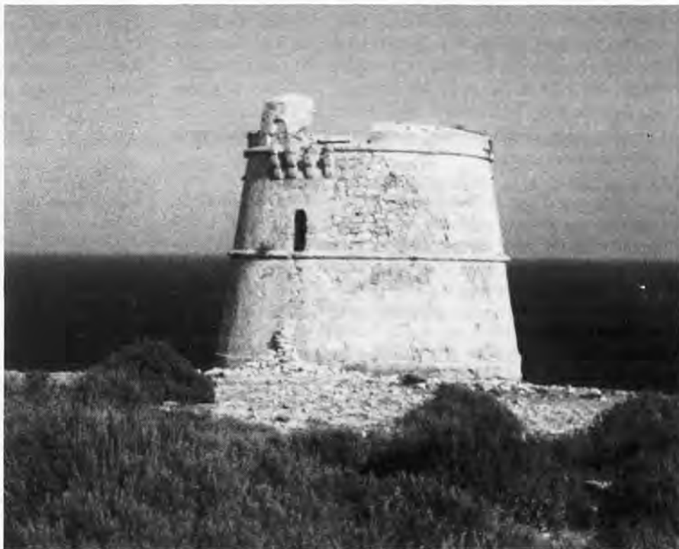
Torre del Cap de Berberia.

A la fin des années cinquante, l'amélioration du niveau de vie des européens donne naissance à ces grandes migrations de touristes vers le Sud de l'Europe, les plages, le soleil, et la sangria à bon marché! Grâce au tourisme, l'Europe du Sud sort de la misère. Hélas, le paysage paie les conséquences de l'avalanche touristique; et, le plus souvent, l'essentiel des bénéfices reste à l'étranger. Formentera, avec son clima agréable hiver comme été, ses grandes plages, ses eaux limpides, son paysage bien conservé, sa tranquillité, est une tentation pour les «fous du béton». Mais Formentera a tenu tête, et elle est restée presque vierge jusqu'à nos jours. Les formenterenses ont su monter leur petit commerce (hôtel - restaurant - magasin) pour vivre des visiteurs, mais sans se