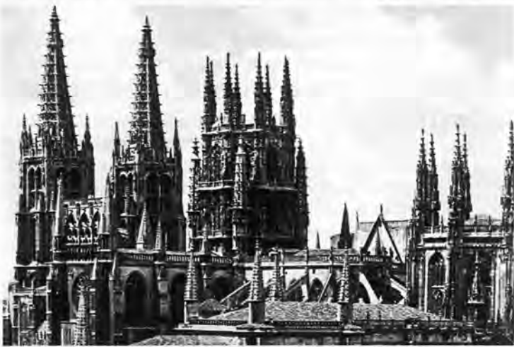
Vista de la Catedral.

Reglón aparte a esta ciudad la recuerdo con cierto desencanto. Había terminado la Guerra y el destructor «Ciscar» del cual yo era tripulante, marinero-cocinero de Jefes y Oficiales y, además, en «zafarrancho de combate» conductor de municiones del cañón 4, —proyectiles que pesarían 60 o 70 y tantos kilos, navegando en el Mar Cantábrico y con un oleaje que nos barría la toldilla y a nosotros convertido en un infierno— y, por la simpleza