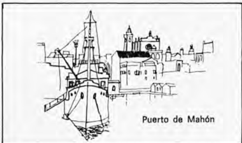
Puerto de Mahón

CALA SAN ESTEBAN . A 4 Km. de Mahon, ruines des forts anglais de St. Philips et Malbourough.