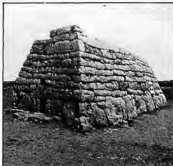
Naveta dels Tudons (Ciutadella)

NAVETA DES TUDONS . A 5 Km. de Ciutadella. Magnifique monument préhistorique.