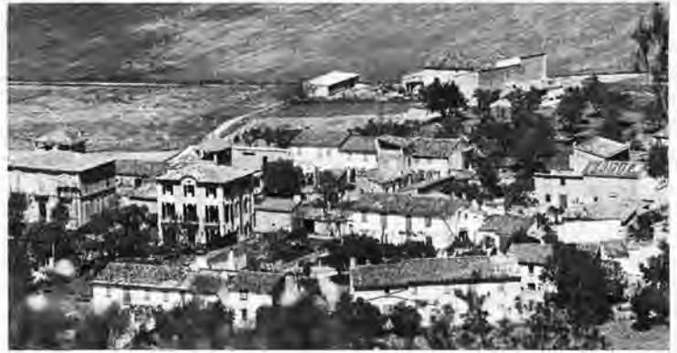
Una bonita panorámica de la barriada de s'Escaleta, Es Cos, Sa Clota, Ca'n Noviet, Ca'n Marcó, Ca'n Seguina, etc.

Vaya la que se armó. Los guardias civiles siguieron tomando la nominación y domiciliación de cada uno de los sorprendidos a cuyos, ya se les había atragantado la pasta seca y dulzona de los higos, el que más y el que menos ya comenzaba a erutar la esencia alcohólica y espirituosa del anís. Nada menos; la Guardia Civil. Fijense ustedes la tropelía con que podía verse incurrido inocentemente aquel joven militar, soldado y disfrutando de una licencia relativa. Al siguiente día tuvimos la obligación de comparecer a la Casa-Cuartel y reafirmarnos de la causa por la cual habíamos sido sorprendidos. Aquí comenzó a incoarse una causa la cual todos ignorábamos cuales podían ser sus resultados, habida cuenta que, en un espacio de unas semanas fuimos requeridos con señalamiento de día y hora para la celebración de un Consejo de Guerra sumarisimo en la Sala sito en el Cuartel de Infantería, Plaza del Carmen, ciudad de Palma.