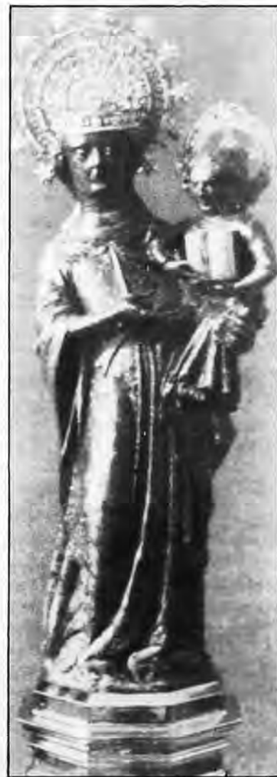
Bellísima imagen de Ntra. Sra. de Lluc.

Esto fue en síntesis lo que no se pudo publicar a su debido tiempo.