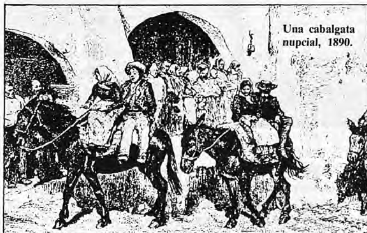
Una cabalgata nupcial, 1890.

En los umbrales del siglo XXI estamos asistiendo a la desintegración de la vida familiar. Los matrimonios —muchos de ellos— no mantienen aquella unidad de destino ancestral que los caracterizaba. Ni los hijos de hoy aceptan aquel tutelaje paternal más allá de su pubertad. Se va sustituyendo el clásico matrimonio por el moderno concepto de pareja. O mejor aun, por el de compañero o compañera sentimental. Sin lazos consolidados los compromisos que se establecen contienen un componente de provisionalidad que se diluye a la primera contrariedad. Hay mujeres —ellas que habían sido las más conservadoras de la tradición— que cambian de marido en cuanto encuentran otro hombre que les apetezca más y se deje seducir por ellas. La actualidad populariza a algunas que tienen hijos de tres maridos; estando los tres vivos. Si lo más convincente es predicar con el ejemplo esta es la virtud ejemplarizante que reciben sus descendientes. Y esa norma desmoralizadora está de moda y avanza por Occidente con una impunidad preocupante. Hasta ahora no parece que la sociedad se preste a reaccionar con medidas correctoras de higiene moral.