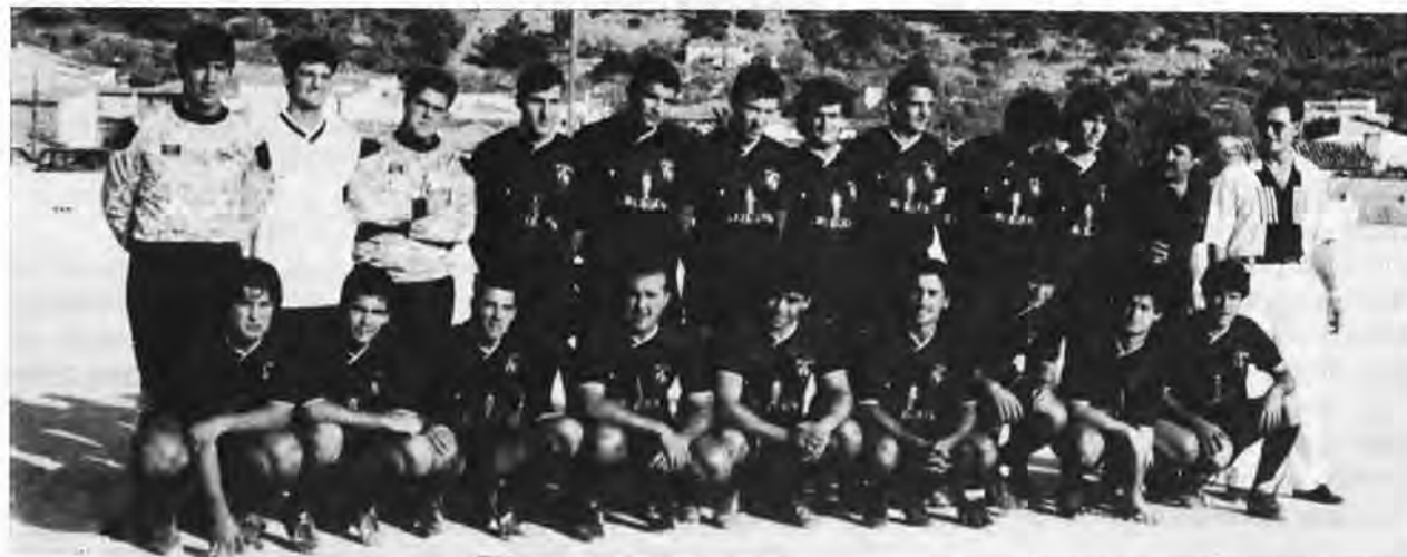
Futbol Club S'Arracó

Desde los años de la pera las fiestas siempre se manifestaron en demasía por el excesivo abundamiento en el uso de la «murta» en la decoración de arcadas, forros en los postes y guirnalda que circundaban la separación del recinto bailable y el público. Es una verdadera pena que en la plenitud y festividad de Ntra. Sra. de la Trapa, se omita y se le niegue el «pan y la sal» por cuanto requiere una finísima alfombra de «murta»