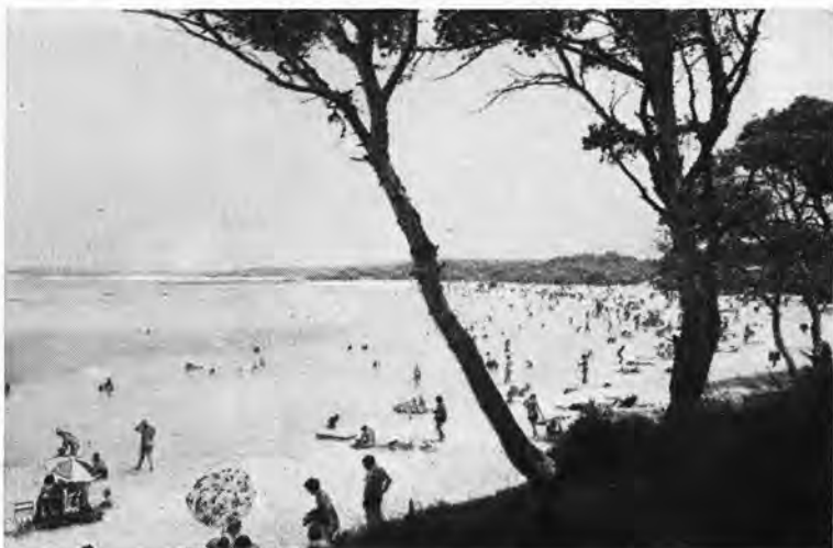
COLONIA DE SANT JORDI - MALLORCA

Voilà donc la valeur de Campos: beauté d'authentique vie rurale et beauté d'une nature presque vierge. Une ville pleine de souvenirs historiques et un bord de mer qui nous offre toute sa beauté primitive.