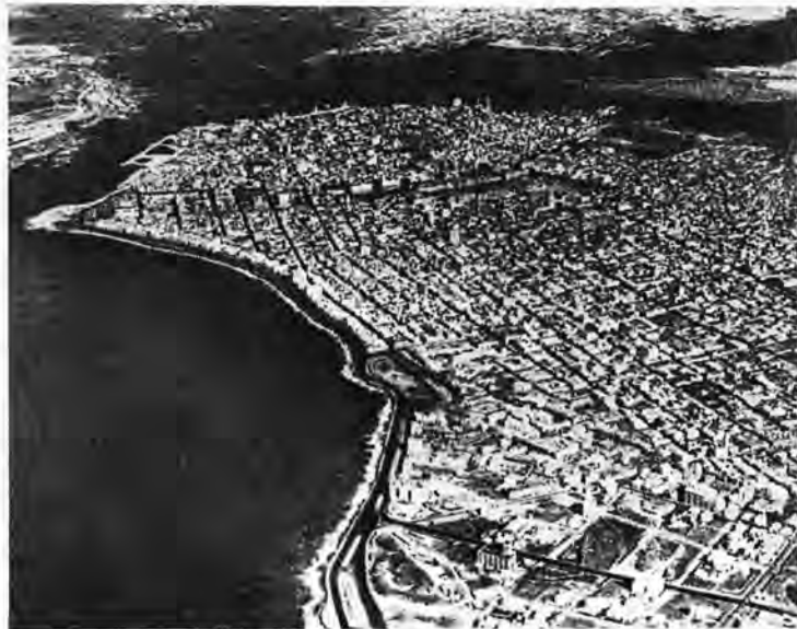
Cuba: panorama aéreo de La Habana.

Efectivamente tenía toda la razón del mundo no obstante, no todos los peligros debemos achacarlos al avión. En las vaguadas de los valles, en las mismas riberas de los ríos o riachuelos