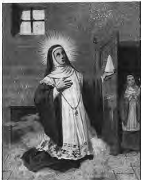
El cielo regala a Catalina Tomás con riquísimo panal de azúcar.

Santa Catalina Tomás, religiosa canonesa de la Orden de San Agustín, nació en Valldemosa, pueblecito de Mallorca (Baleares), a primeros de Mayo de 1531; dando desde su edad más temprana pruebas de la más insigne santidad, y distinguiéndole el Señor con los favores que reserva para quienes trata de llevar a su gloria. Dios le enseñó los caminos del amor, y ella quiso corresponder a las finezas divinas con las fragancias virginales de su casto corazón. Rechazada en uno y otro convento, insistió Catalina en su propósito de nunca tener otro esposo que Jesús, y Este, que se complace de andar y conversar entre lirios, aceptó el generoso ofrecimiento de la inocente Virgen. Se abrieron para ella las puertas del convento de Santa Magdalena el 13 de Noviembre de 1552, comenzando el noviciado el 25 de Enero de 1553 y profesó el 24 de