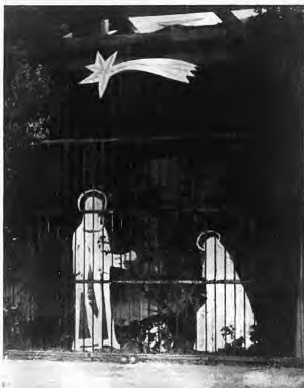
Venid y caminaremos a la luz del Señor.

Las «neules» otra de las atracciones que para los niños les atraían estas especies de golosinas fabricadas por los «neulers» a base de pasta de pan, huevos y azúcar. Las «neules» eran importadas de las tahonas palmesanas que tenían una primorosa especialidad en su fabricación y nuestra gente menuda