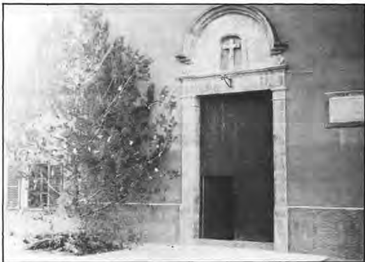
En el frontispicio de la parroquia del Santo Cristo de S'Arracó aparece el árbol navideño, alegoría de la Navidad repleto de óbleas en forma de estrellas e iluminado por luces blancas y de colores.

Son de blanquísimo papel, de forma redonda con los más variados dibujos. Las monjitas Agustinas eran verdaderas artífices para lograr a la perfección motivaciones dedicadas a la Natividad del Niño Jesús. En el lamparón principal o central del templo se cuelgan tantas obleas como semanas y días faltan para iniciar la Cuaresma.