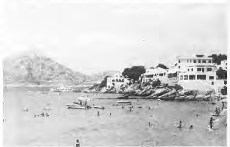
Vista parcial de la playa de San Telmo poco concurrida a primeras horas de sol por la mañana. Las primeras casitas de recreo que bordean la orilla. Al fondo la bella silueta de la Dragonera y el Faro Vei.