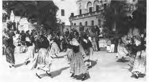
Danses populaires à Lloseta.

Les Baléares possèdent une richesse sans pareil en coutumes belles et ancestrales. Les verreries majorquines, les bijoux de Minorque, les sculptures en bois d'olivier, les objets en raphia et jonc, le fer forgé, les tissus «de llengos», les broderies, etc., sont célèbres dans le monde entier. Ces échantillons de l'artisanat balear présentent la beauté de l'ancien avec celle d'une confection soignée.