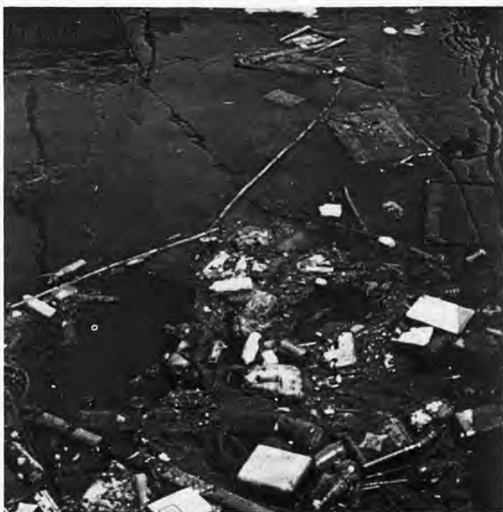
(Termina en la página siguiente)

Cada día se intensifican las voces de alarma que vaticinan la destrucción paulatina del ambiente natural de nuestro entorno. Los movimientos ecologistas emergen con fuerza tratando de alertar a la sociedad de los peligros que nos acechan si no se pone coto a los desmanes que alteran los principios vitales establecidos. A la naturaleza no se le burla impunemente. La tecnificación está pagando su tributo con catástrofes causadas o responsabilizadas por el hombre. Desde el dióxido de carbono de las combustiones hasta los excesos constructivos se intenta concienciar a la sociedad de los perniciosos efectos sobre personas y paisajes. Disminuyen las aguas químicamente potables en la naturaleza y proliferan las aguas subalveas contaminadas por tanto pesticida, vertederos de basuras y deshechos de la vida moderna. Hasta el mar Mediterráneo —casi un gran lago— se le augura la destrucción de su ecosistema por la progresiva contaminación de vertidos costeros. La lluvia ácida esquilma los bellos bosques del centro de Europa. La inmensa cuenca del Amazonas —considerada como el mejor pulmón del mundo— es víctima de talas irresponsables de su arboleda y de incendios interesados que calvinizan sus frondosos bosques. En el polo norte se ha producido un creciente agujero en la capa de ozono atmosférico protector contra los rayos ultravioleta que pueden causar cáncer. Todo agravado por la acción indiscriminada de las sustancias químicas sintéticas que se utilizan como refrige-