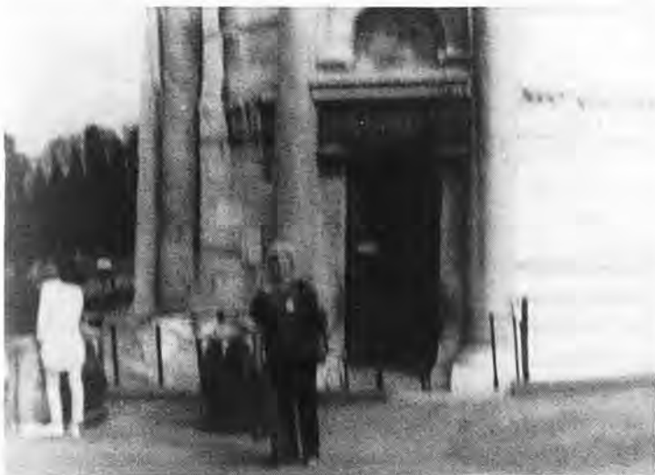
Antes de su despedida de la ciudad de Roma doña Carmen se deja impresionar bastante alejada del objetivo, ante una de las muchas iglesias romanas.