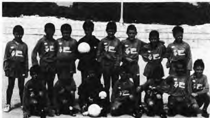
Una instantánea del equipo «benjamín» del Lloret, antes del partido en su salida al campo, equipados con jersey, pantalones y calcetines azules. Dos porteros, uno bajito de estatura, dos maravillas, muchas ganas de jugar todo el equipo y de ganar.

El programa de las fiestas ya nos había predispuesto de la celebración de una MISA SOLEMNE, así con mayúsculas, sin embargo nadie se esperaba que fuesen 24 los sacerdotes concelebrantes y el oferente fue el párroco Rvdo. D. Santiago Cortés. Total 25; además de algunos sacerdotes auxiliares. El sermón estuvo a cargo del Rvdo. D. Juan Parets Serra, todo un diplomado en la historia de Lloret. El templo ofrecía un aspecto impresionante de fieles y en las lámparas laterales y central pendían más de 200 bombillas encendidas, tubos fluorescentes y luces fijas en el altar mayor, obra primorosa del párroco anterior Rvdo. D. Miguel Mulet, actual párroco de San Antonio Abad, en la Puebla, y que allí estuvo concelebrando. el coro parroquial magnífico, siempre bajo la experta dirección de Sor Josefa, Religiosa Franciscana Hija de la Caridad de aquella casa conventual. El Ball de l'Oferta, pero que gracia y donaire en el baile de aquellas tres parejas. Y que maravilla y como baila la señora Alcaldesa acompañada del Sr. Alcalde?