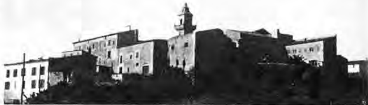
Vista de un grupo de edificaciones en el entorno de la iglesia parroquial con su campanario en lo alto del promontorio cerca del cielo. Una reducida panorámica captada desde la llegada por la carretera de Sineu.