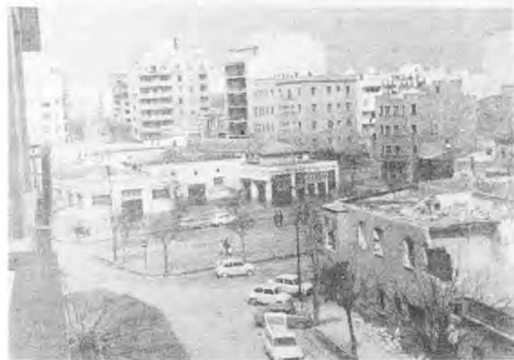
En primer plano entrada a la calle de Capitán Vila. En el centro vista parcial del mercado de la plaza de Pedro Garau, antes de ser reformada, en pleno barrio de La Paloma. Al fondo la calle Luca de Tena.