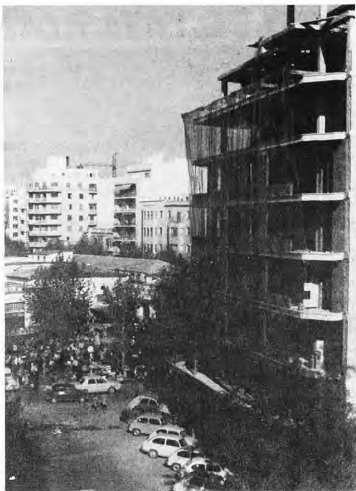
Vista parcial de la finca «Garau» en el momento de su construcción y esquinada a la plaza de Pedro Garau, en una mañana de mercado; martes, jueves y sábado.

Vaya millonada y vaya fiesta que se darían bastantes familias del barrio de La Paloma!