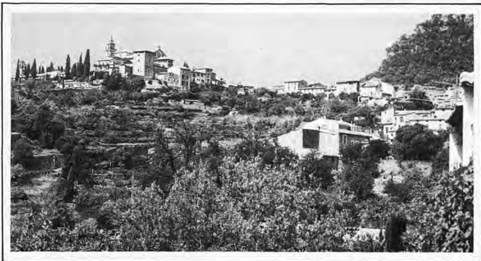
Valldemossa, site protégé.