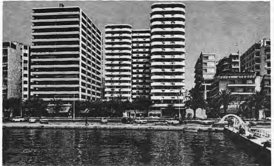
Un mur de beton au bord de l'eau, c'est la «Balearization».

Pour beaucoup de touristes, Majorque «c'est trop vu». Ils se sentent attirés par d'autres horizons tels que la Turquie, la Tunisie, Chypre, ou le Maroc. Certes, ces pays n'ont pas encore une infrastruc-