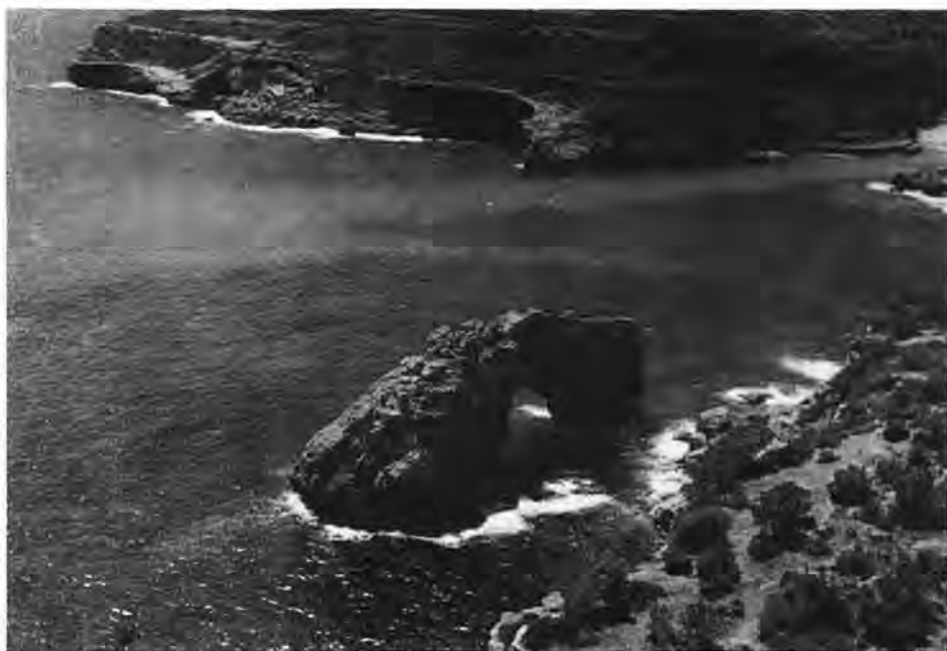
Il reste encore quelques coins vierges, mais pour combien de temps? («Es Pontàs» de Santanyí).

D'une année à l'autre, le nombre de touristes augmente, mais le volume de leurs dépenses diminue. Au cours de la saison 88, les dépenses ont diminué de 2% par touriste et par jour. En 17 ans, de 1971 à 1988, les dépenses des touristes ont diminué de 20%. Notre Conselleria de Turisme chiffre à 15.000 pesetas par jour, le coût idéal d'un jour à Majorque; our la moyenne actuelle se situe à 5.000 pesetas par jour, à peine le tiers de la somme idéale. Et si, dans un proche avenir, les meilleurs de nos touristes profitent de la chute du dollar pour s'en aller