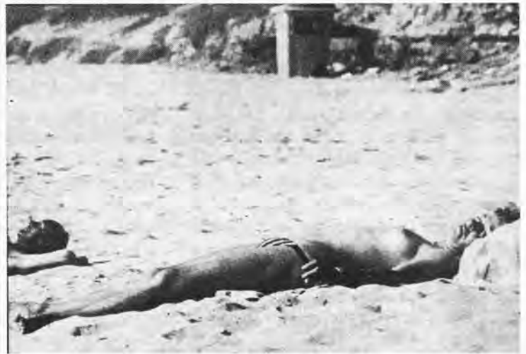
Baigneur a la plage le mois du novembre.

Majorque a bénéficié, cette année, d'un automne particulièrement doux et ensoleillé. Ainsi, le premier novembre, pendant que les familles se rendaient au cimetière fleurir les tombes de leurs parents décédés; les plages recevaient la visite de baigneurs bien décidés à mettre à profit le beau soleil de la journée, surtout au cours de la matinée.