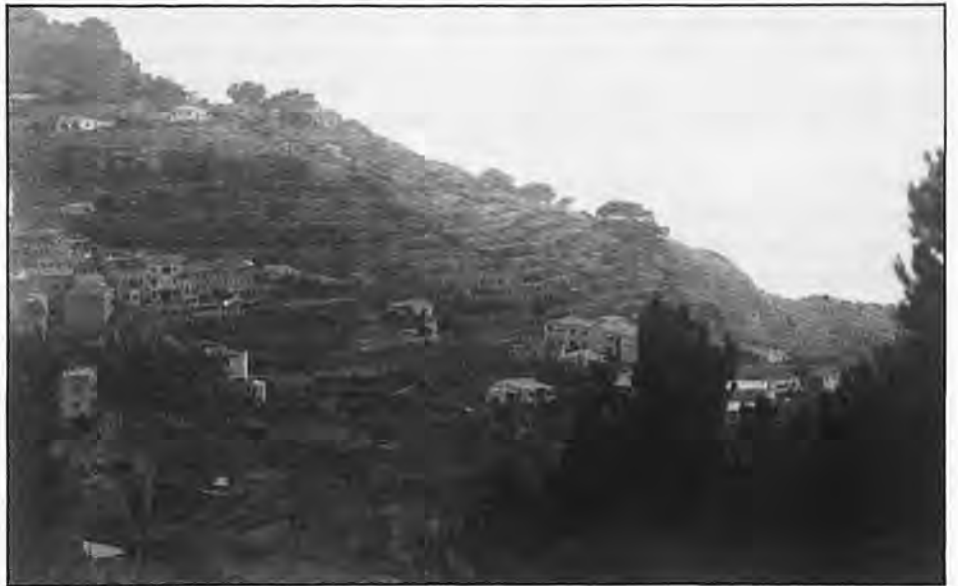
Hermosos bancales en Banyalbufar (Mallorca).

De esta situación no es la aceituna la única agravante responsable. Los precios de la algarroba, este año, han sido ruinosos. Y las posibilidades de mantener, en buen estado, los bancales en las laderas —única manera de evitar la erosión de la tierra cultivable— es nula, salvo que la inversión, muy gravosa, la pue-