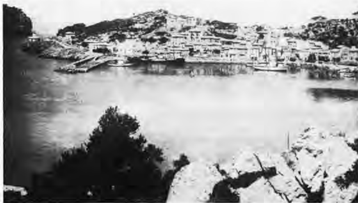
SÓLLER. Vista general del Puerto. Any 1920.

Llegando a Marseille descargaban el velero, ellos mismos. A medida que necesitaban mercancía iban sacando, porque ellos eran los transportadores, los transitarios, los comerciantes al por mayor y menor. No había intercambios. Directamente de la producción al consumidor. Suprimían gastos, comían y dormían en el velero, todo el tiempo que estaban en Marseille.