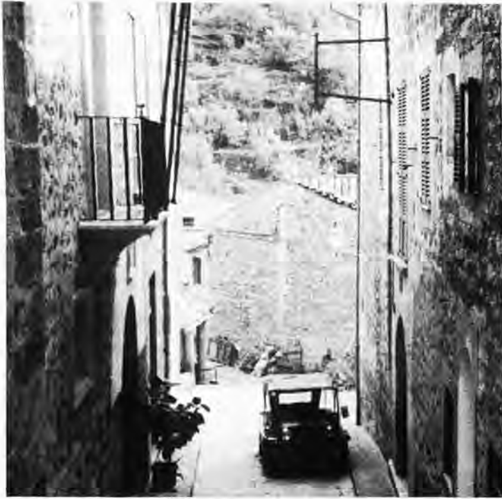
Façade et balcon de la Mairie de Fornalutx.

Jusqu'en 1812, le joli et charmant village de Fornalutx était un petit hameau de la commune de Sóller.