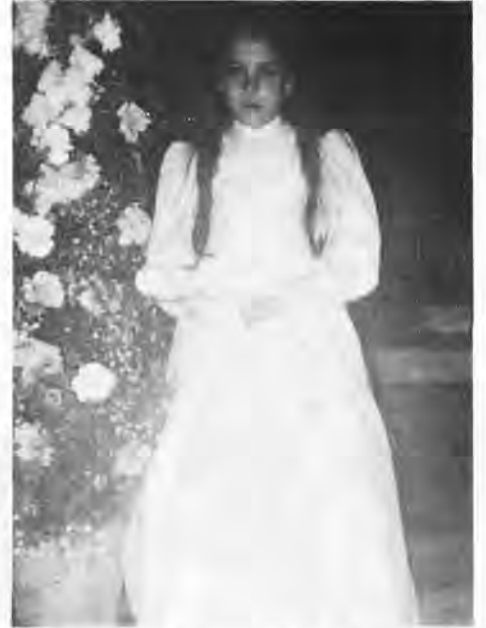
BLANCA COM LA NEU

Las familias Riera, Morro y Rosselló, y sus amigos almorzaron en un conocido restaurante del Paseo Marítimo palmesano. Fue una jornada magnífica, de la que todos guardarán un agradable recuerdo.