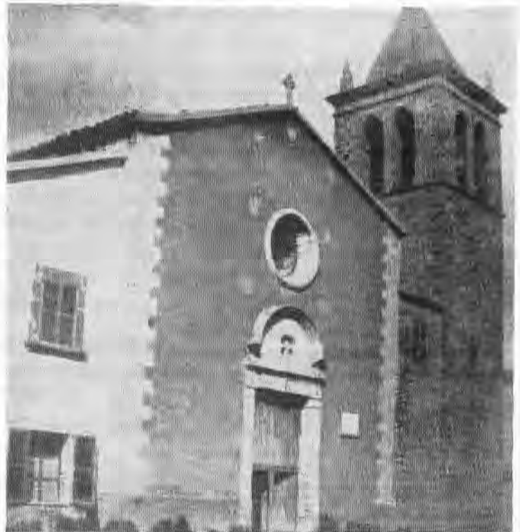
Templo parroquial del Sto. Cristo de S'Arracó, en donde es venerada Ntra. Señora de la Trapa