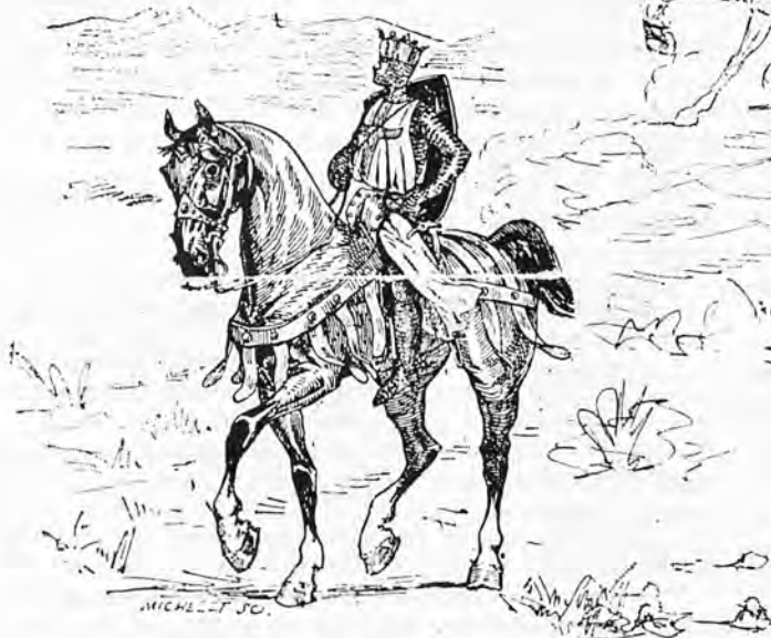
Il partit pour la Palestine. (Dessin de L. Vallet.)

cate Marthe de Baudéan : le Lierre uni au Chêne.