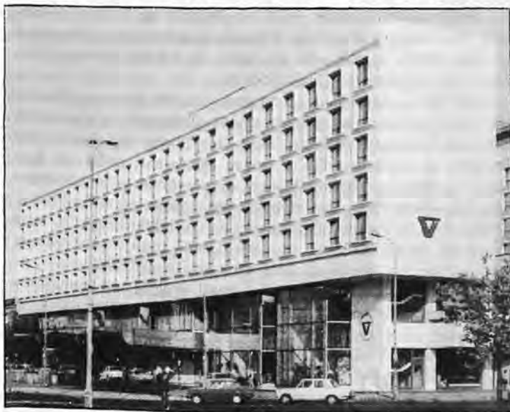
L'hôtel Victoria Intercontinental de Varsovie.

située à une profondeur de 125 m. sous terre. Le sel puise ici, depuis le XIX siècle a été destiné au Grand duc de Varsovie, créé à l'époque d'où le nom de la chambre. Elle donne l'impression d'une vaste salle de spectacles creusée naturellement dans une roche de sel. A droite de l'entrée, sur un jambage, il y a un podium pour l'orchestre, et de l'autre côté de la salle, une vaste estrade, avec les coulisses cachées derrière la roche en sel. La statue de deux "frères mineurs" qui avec le sourire sortent d'une étroite galerie, à droite de la salle (l'oeuvre de S. KOZICK 1961) et aussi comme partout le symbole des mineurs "deux marteaux de mineurs entrecroisés, composés de nombreuses petites lampes sur le plafond, constituent une décoration permanente de l'intérieur. Le reste de l'équipement est varié selon les besoins, car cette salle sert à différentes fonctions, tantôt de salle de sports (tennis, basket ball, volley) et aussi de concours de modèles télévisés. Pendant l'été, la Direction de la mine, rend cette