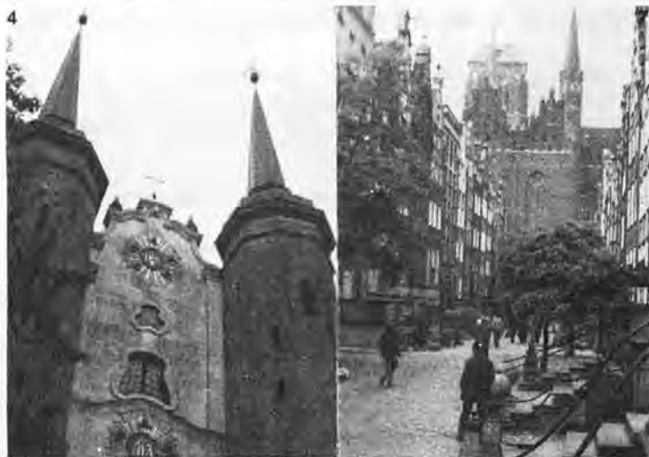
"DEUX ASPECTS DE GDANSK"

La Reine CUNEGONDE, a vécu au XIII e siècle, c'était la fille du Roi de Hongrie, BELA IV, de la dynastie ARPADE, et de MARIE, fille de l'Empereur Byzantin, et elle est devenue la femme du prince des Provinces de Cracovie, et de Sandomierz.