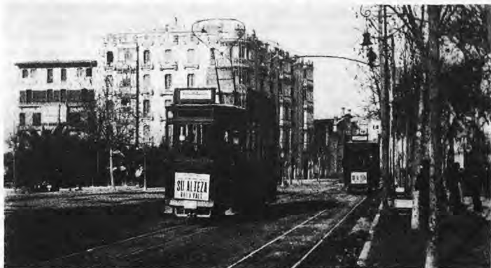
Los tranvías eléctricos atravesando la Plaza de España, delante las estaciones.

La estación del ferrocarril digamos de vía estrecha, quedaba unida en los mismos aledaños de la plaza con los principales núcleos de poblaciones y villas importantes del interior de la isla. Los precios de los billetes eran modestísimos en todas sus líneas, las llegadas y salidas se iban sucediendo si no con la máxima puntualidad sí con presteza. Los pitidos se iban repitiendo una y otra vez con bastante intensidad durante el día, mientras en altas horas de la noche eran más recortados. Los gritos de los fogoneros, el chirrido de las ruedas de los vagones al ser maniobradas