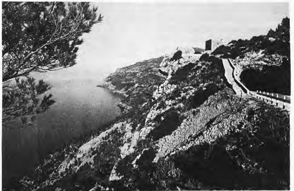
Hérmoso mirador en la Sierra de Tramuntana. Estalenchs (Mallorca).

Por eso el cultivo de dicha sierra se degrada ostensiblemente. El descuido o abandono de los terrenos se generaliza notoriamente. Se derrumban sus infinitos bancales, construidos, en el pasado, con tanta profusión y sacrificio. Se siguen arrancando los viejos olivos —pese a todas las protestas— tan característicos de dicha zona para aprovechar su