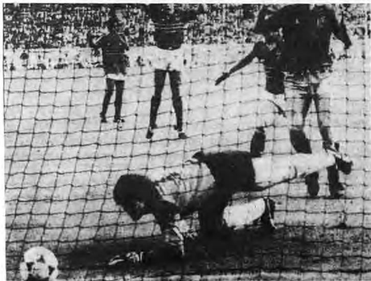
Gol de Francia. Único fallo de Arconada. (París)

Su primera gran victoria la obtuvo Paulino sobre Harry Wills, después en Nueva York, en el Stadio de Brooklyn, tuvo que vérselas con el "panadero de Boston" una mole de carne