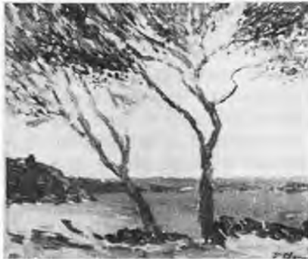
El Toro (1979).