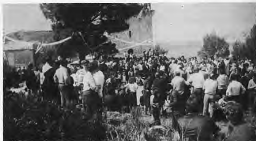
Romería del "Pan Caritat", de San Telmo.

El sol habiendo participado en la fiesta, y el público también, ésta fue un logro de lo más popular que se ha