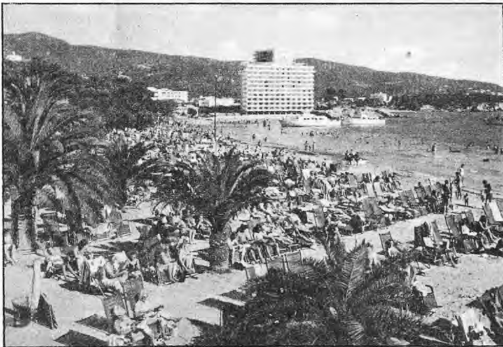
Nos plages ont bénéficié d'un début de saison exceptionnel.