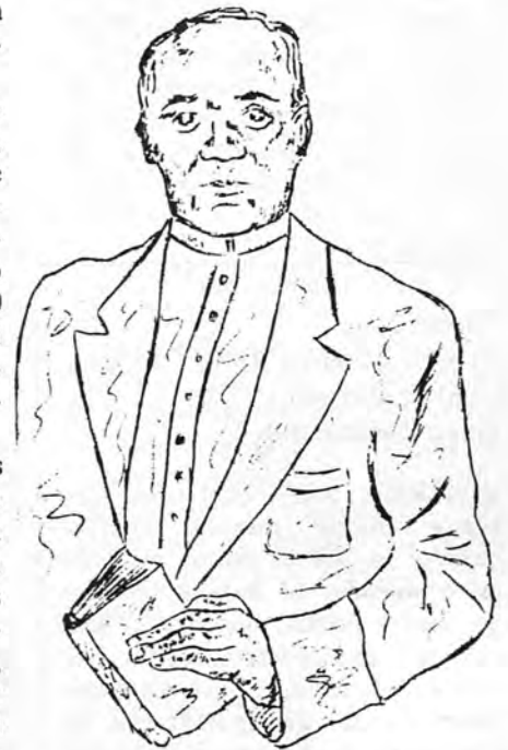
Ayuntamiento de la misma villa una calle en 1935, con motivo de la publicación de "La minyonia"

En 1928 fue proclamado Hijo Ilustre de Campanet, dedicándole el