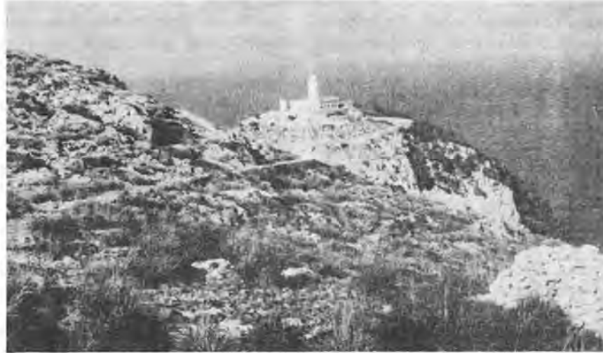
Faro del cabo de Formentor, a 184 metros sobre el nivel del mar y 25 metros de agua a su pie. Fue inaugurado el día 30 de abril de 1863. El Faro Vell de la Dragonera, lo fue en el año 1940 y, en 1853, sufrió una nueva remodelación o restauración.

—Que se vayan nadando a tierra mallorquina —contestó—.