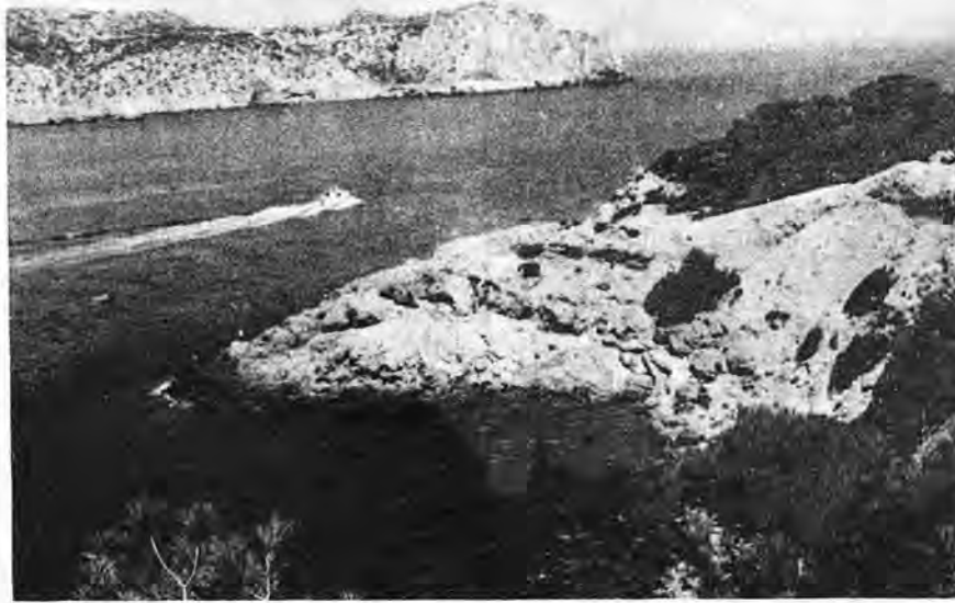
Vista del "Freu de Sa Dragonera", desde Punta Negra a Cap de Tramontana. A comienzos de siglo y a efectos de retribución a los torreros del faro, absurdamente se consideraba al islote o isla "mig-illada". Ahora, a dos decenios de su final haga usted también sus conjeturas.

La Bonanova y sus tres hijos, retornados con inmensa alegría y no menos regocijo al islote más ambicionado por ellos de todo el archipiélago balear. La Dragonera. El encuentro entrañable con sus hermanos, continuadores aún de la explotación agropecuaria del islote en toda su extensión. Su toma de contacto con sus compañeros torreros y familiares. Su entrada en servicio como torrero en el faro de sus sueños. La gran satisfacción