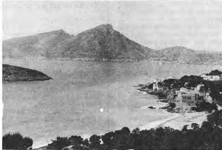
En primer plano la playa de San Telmo. A su derecha Es Geperut y caserío de Na Caregola. A la izquierda punta Norte del islote Pantaleu y, al fondo, amplia panorámica en su parte central de la Dragonera. En la cumbre de la misma enclava del edificio "Faro Vell", sin techumbre y en estado ruinoso.

muy costosas. Además de una gran explanada o patio se levanta un bonito inmueble cuyas fachadas son de piedra picada y estaba dividido en tres viviendas, una para cada uno de los torreros y familia allí destinados. Las referidas viviendas estaban distribuidas por cocina, comedor y varias habitaciones. Las viviendas del torrero 1.º y la del 3.º, tenían acceso directamente a una especie de galería subterránea que ellos denominaban "la mina".