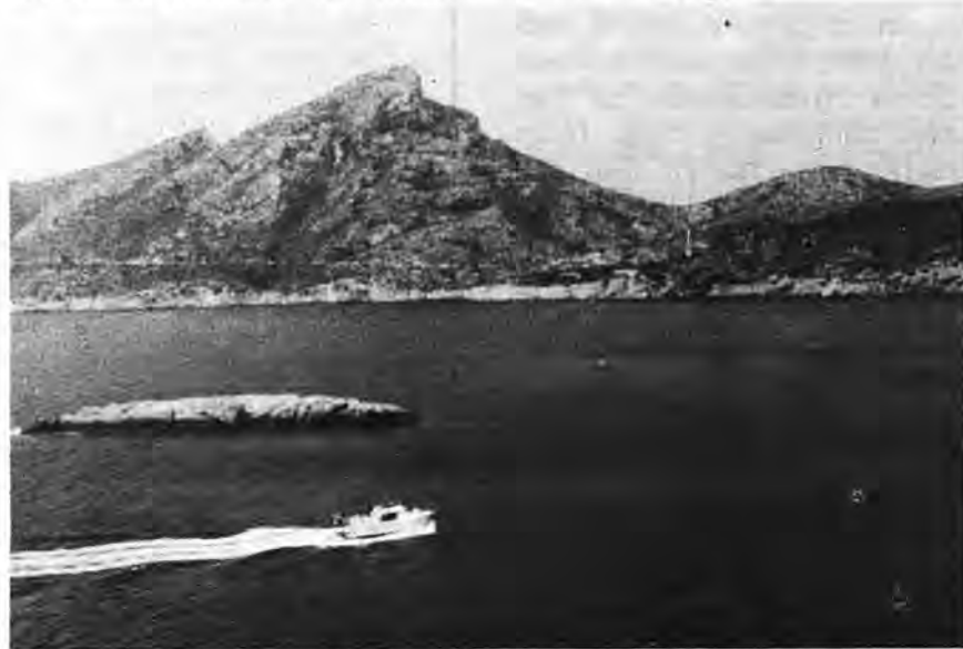
En primer plano "Illa Mitjana", islote de 80 m. de longitud de N. a S. y 40 m. de E. a W. elevándose 8 m. sobre el nivel del mar. Al fondo parte central de la isla Dragonera vista desde el E. En su parte más septentrional, y casi a ras del mar, "Sa Cova des Bocs", y a la punta o morro de su izquierda algo oculta, entrada a "Cala Lledó". El "Faro Vell" coronamiento del punto más culminante del "Puig de Sa Popi" en la Dragonera.