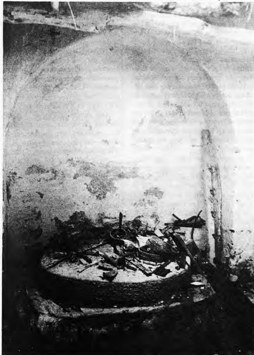
Interior del Molí de Son Moner. Febrero 1980. (Foto Bernat Crespi).