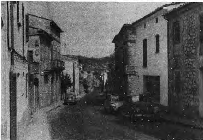
Vista parcial de la "calle de Francia". De aquí emigraron en su día muchos arraconenses para dedicarse a la navegación, otros escogieron a Francia en busca de mejor ventura. Francia ahora está ahí mismo, comercios extranjeros y turismo, Caja de Ahorros atestada de imponentes repartiendo buenos dividendos y premios en especie.