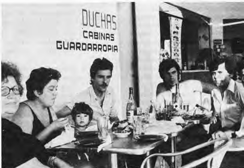
Un tentempié en familia entre caras conocidas, agotadas del trabajo. Una parrillada de pescado, buen vino, aceitunas y un pan de dos kilogramos sobre la mesa. Diez días después sobre esta misma mesa la friolera de nueve millones de pesetas, para dos afortunados por la lotería y por supuesto, caras más alegres y satisfechas. Un buen remate de temporada a dos de los empleados del Bar Baleario de San Telmo.

El sabático día 8 de septiembre del presente año, podría ser para este lugar un día "histórico" o por lo menos, muy digno de tener en