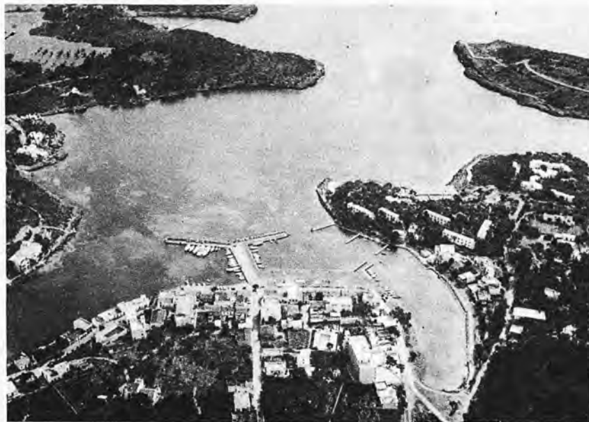
Vue générale de Porto Petro. Sur la droite on voit clairement les maisons du club.

tranquilité, la quiétude, la fraîcheur sont assurées à ceux qui fuient la grande ville, à ceux qui veulent profiter des vacances pour reprendre contact avec la nature. Avec une nature domptée par l'homme, embellie par ses mains.