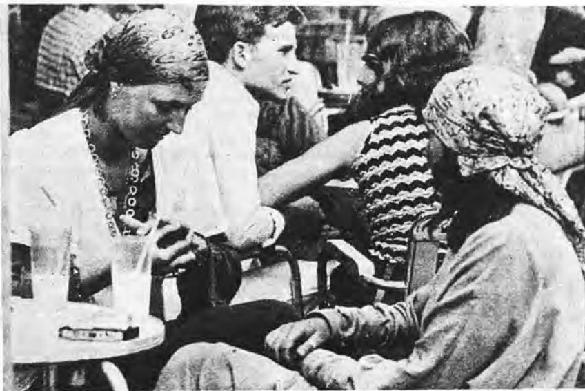
Davantage de touristes... Mais moins de devises.

Lors de la célèbre dévaluation du dollar, l'Espagne qui vivait alors une ère de triomphalisme délirant, a refusé de suivre le mouvement. On a voulu ainsi montrer au monde entier que la peseta était une monnaie forte "que goza de buena salud" selon l'expression consacrée. Le résultat, hélas, fut moins brillant: les exportations devinrent plus difficiles car les produits espagnols n'étaient plus compétitifs: les importations augmentèrent, et le tourisme à bon marché (le seul que nous ayons) ralentit. Pire encore, les espagnols purent