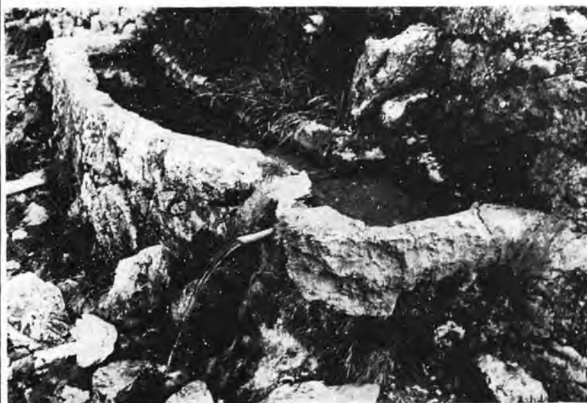
"Sa Font des Noguers" (Almallutx) en voie d'assèchement, tout comme des centaines d'autres, à travers Majorque.

Même s'il arrivait qu'il pleuve beaucoup, et malgré l'appoint appréciable des barrages de Cuber et du Gorg Blau; Majorque risque fort de se trouver sans eau, dans une période d'environ dix ans.