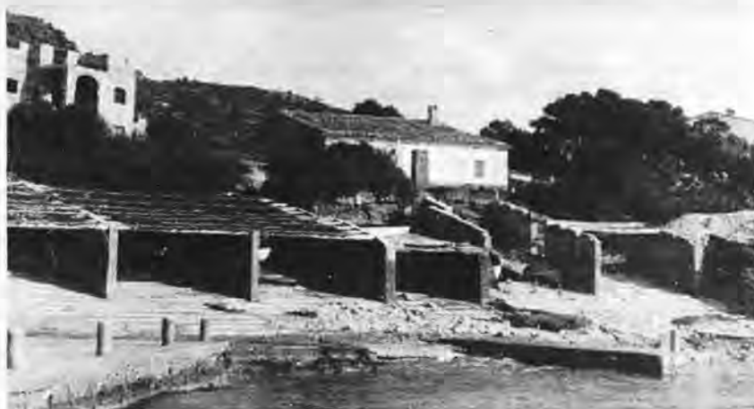
Antigua casa de campo de "Ca'n Perchota", donde está ubicado el restaurante "Na Caragola".

Posiblemente ahora, nos parecerá el caso un tanto utópico o si se prefiere un acercamiento a la comedia o a la farsa. El pago de unas miserables monedas absorbidas por la gravación del impuesto sobre las chimeneas, cuyo censo había sido domiciliario y verificado ante las mismísimas barbas