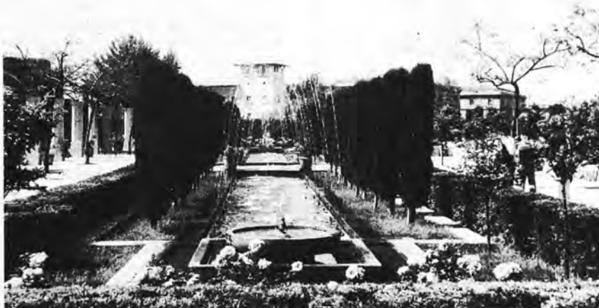
"S'hort del Rei". Ce qu'il faut faire pour attirer le tourisme.

D'autre part, après le décès du général Franco, nombreux étaient les touristes qui évitaient l'Espagne, croyant qu'une guerre civile pouvait éclater d'un jour à l'autre. Grâce au bon sens du peuple espagnol, plus ou moins instruit par l'exemple portugais; grâce à la sagesse des partis politiques, et grâce surtout à la ténacité et à l'adresse politique du gouvernement Suarez, cette éventua-