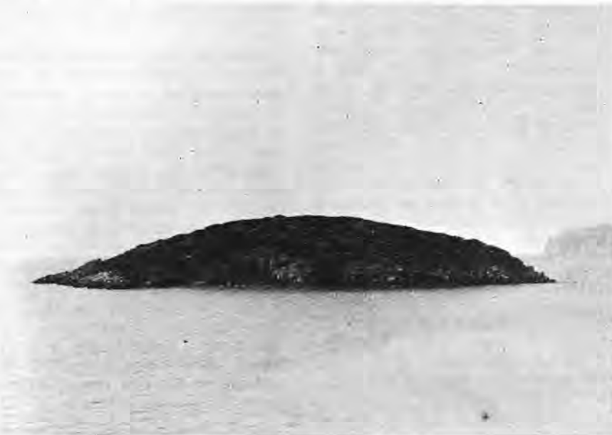
Panorámica del mar de San Telmo. En primer termino el islote Pantaleu, en el fondo el Cap d'es Llebeig, isla de la Dragonera.

Telmo. El amplio ventanal que se nos abre de cara a esta gesta o conjunto de hechos memorables, nos hace sospechar que tal "arribada" forzosa, dicho en términos marineros, con una flota compuesta de barcos o galeras, a remo y velas, y con un cargamento de caballos y tropa de desembarco siguiendo instrucciones de la nave capitana. Todo hace suponer que este mar de San Telmo no muy conocido por ellos, espacioso y abrigado de todos los