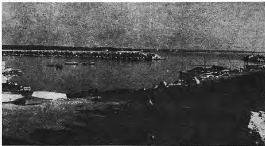
Así estaba el contradique, al ser autorizada la construcción