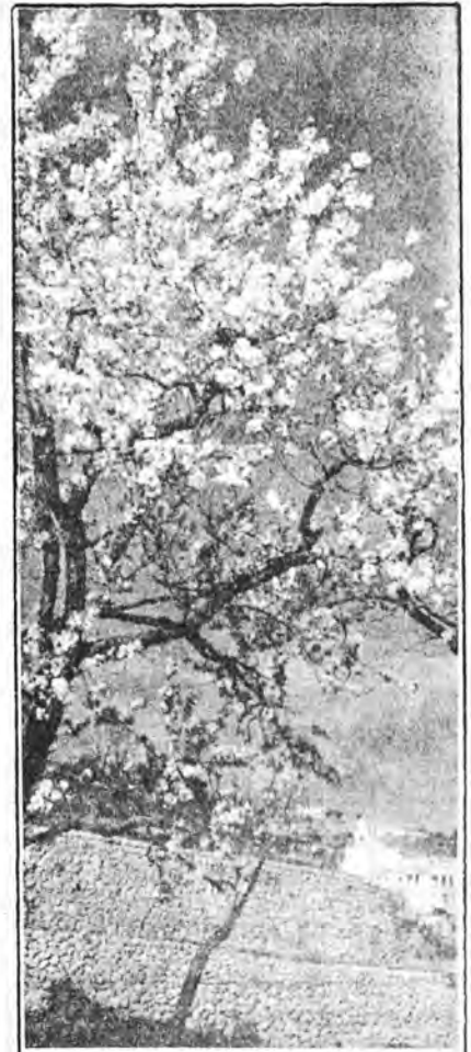
FLOR DE ALMENDRO

Febrero y Marzo vendrán, nevará, lloverá y frío hará, los almendros flores tendrán, y pronto el buen tiempo llegará, el verano y el calor juntos vendrán.