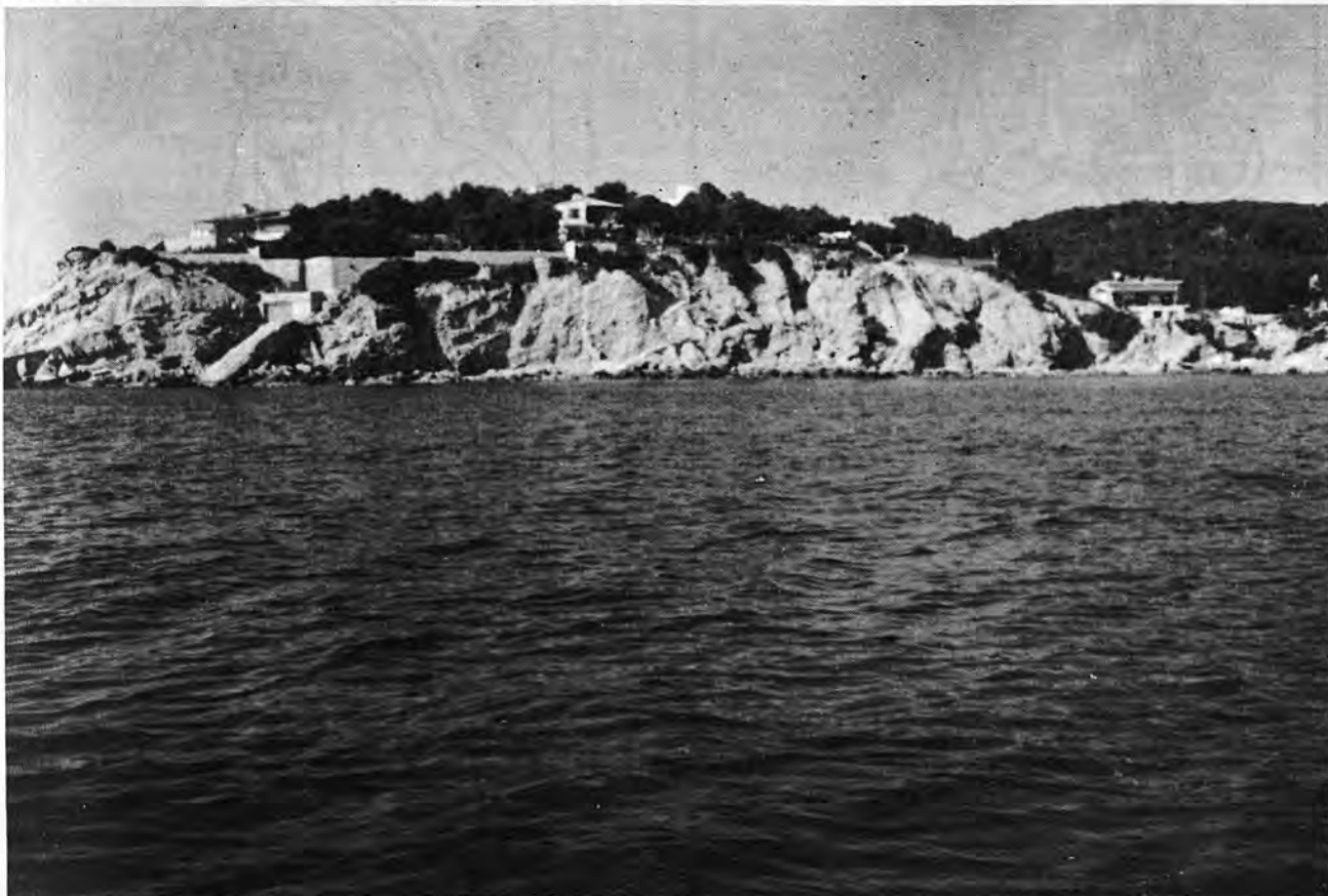
Tramo de costa natural que se conserva dentro del puerto.