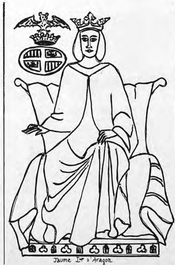
Jaume Ier d'Aragón