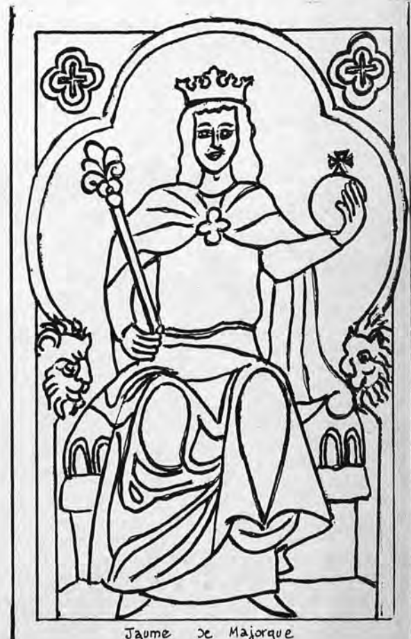
Jaume de Majorque