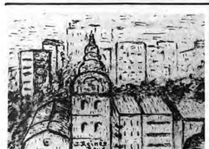
INCA (Dibujo original de José Reines Reus)