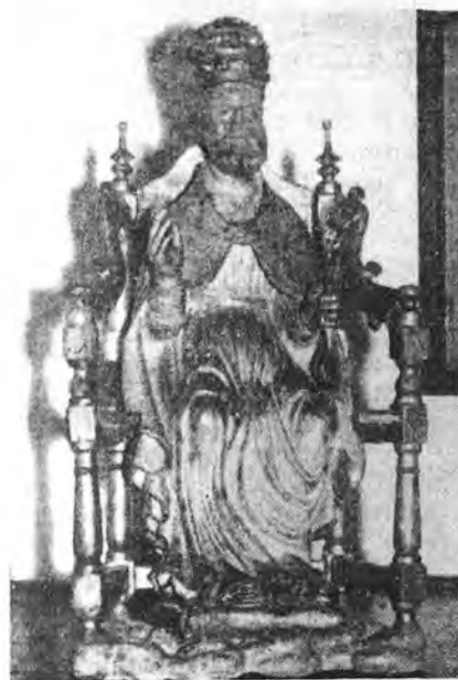
Antigua imagen del Apóstol San Pedro, de nuestra Iglesia Parroquial.

de las mejores fiestas de Mallorca y ello es gracias al entusiasmo que ha venido portando estos últimos cinco años, la directiva del Club de Fútbol local "C.D. Andraitx", organizador de estas inolvidables fiestas de San Pedro que este año entran en su 153 edición.