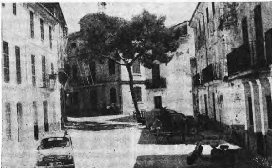
Andraitx. Plaza de San Pedro y Ayuntamiento.

Xesc Forteza puso en escena una gran función teatral muy difícil de olvidar titulada "Un vespre a ca seva... Señora", con un llenazo enorme y con grandes salvas de aplausos en cada acto, finalizó esta velada teatral, el viernes día 28, se celebró un interesantísimo partido de baloncesto femenino de la categoría "Cadete", enfrentándose