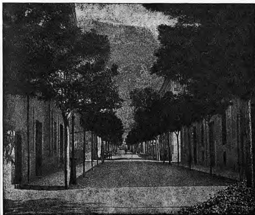
Une rue de Soller