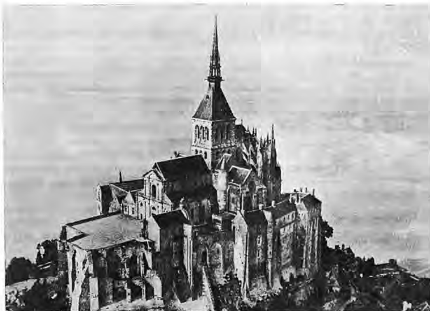
Vista aérea de la monumental Basílica - Abadial du Mont Saint-Michel.

siglo pasado. La nave es un bonito ejemplo de estilo, repito, de nave románica sin bóveda. El coro, con su galería ambulatoria, fue construido entre 1450 y 1521, en estilo flamboyante, en el emplazamiento del coro hay un bonito "triforium" especie de galería que rodea el interior de la abadía sobre los arcos de las naves, en las que suele, haber ventanas de varios huecos. En la primera capilla de la derecha un bajo relieve representa a los cuatro Evangelistas. En la primera capilla de la izquierda otros dos representan a Adán y Eva, expulsados del Paraíso, y la Bajada de Cristo a los Infernos. Estos tres bajos relieves son del siglo XVI así como las dos puertecillas contiguas.