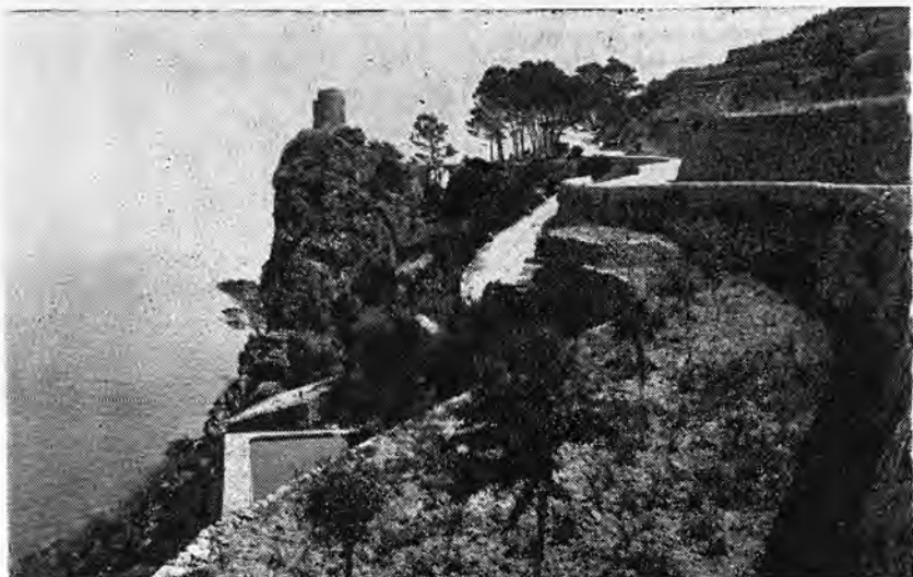
«Torre de las Animas». Bañalbufar

* Les mêmes observations peuvent être faites au sujet des merveilleuses tours de l'ancien télégraphe optique que l'on encore visiter tout autour de notre île.