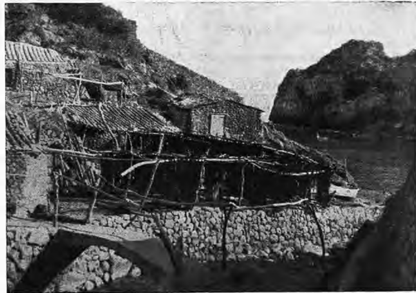
Cala de Deyá

"Els Llinatges Catalans", mentionnent qu'il s'agit probablement au point de vue étymologique, du nom de famille latin "Didianum". Le même ouvrage, cite un autre nom "Daya" de provenance arabe, corres-