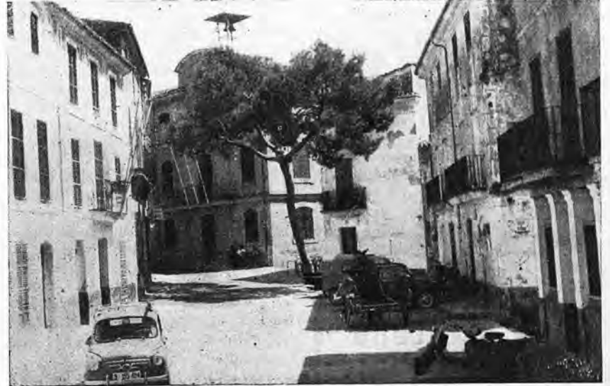
Andraitx. Plaza de San Pedro y Ayuntamiento.

Antes de entrar en el tema "Las fiestas de mi pueblo" os diré queridos amigos que, un pueblo sin fe ni ilusión, es un pueblo muerto, raquítico, sin esperanza de recuperación, estancado en sus cuatro paredes; es un pueblo amargado, dolorido de algo, que no lleva jamás a feliz término ningún propósito, son escépticos y pusilánimes. Pero los pueblos como el nuestro que, con muchos meses de antelación entrega al Excelentísimo Ayuntamiento su programación de fiestas, es un pueblo que tiene fe e ilusión en todo, y estima en lo más hondo de su corazón lo suyo. Y todo esto amigos, embellece la vida de un pueblo, le da garbo y personalidad, y tiene una larga vida por delante.