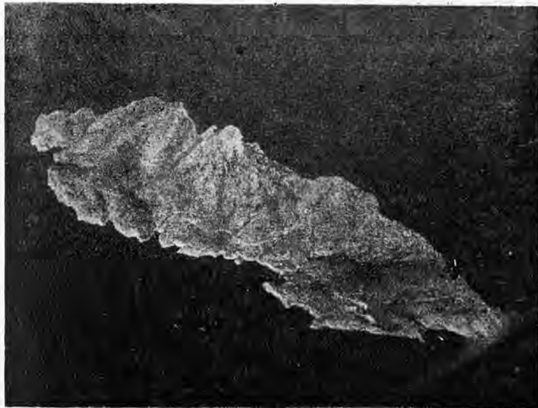
Vista aérea del inconfundible islote de "La Dragonera", enfrente mismo de San Telmo

fruta o patata, correspondían con agradecimiento moviendo su cabeza y haciendo sonar el pequeñito cencerro y bebiendo en su despedida.